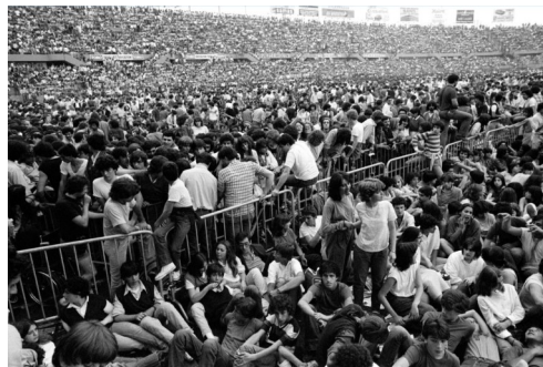
Il pubblico dei Dire Straits allo Stadio Comunale

Dai primi del Novecento a oggi, la ricca antologia (circa quattrocento immagini, articoli, manifesti, locandine e documenti) testimonia l'evolversi della società attraverso la lente d'ingrandimento dei concerti che hanno avuto luogo nella nostra città.