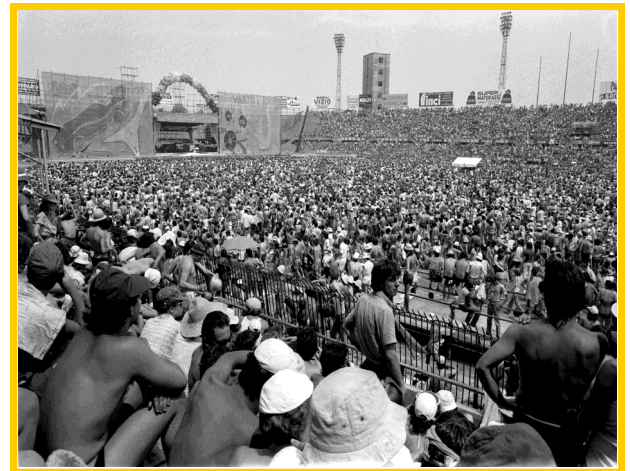
I Rolling Stones al Comunale

Sabato 22 ottobre 2022, ore 17 via Barbaroux, 32 ingresso libero a invito